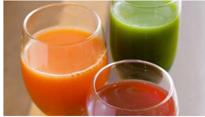
コールドプレスジュース

低圧搾方式で、野菜や果物の栄養分を壊さず摂取できる 100%の抽出ジュース。下記より1種日替わりでご用意。