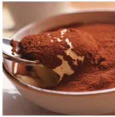
Tiramisù Traditional Recipe トラディショナルティラミス