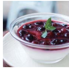
Panna Cotta with Berry Sauce マルサラ風味のパンナコッタ ベリーソース