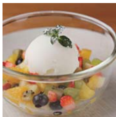
Seasonal Fresh Fruit Salad with Fruit Sorbet フレッシュフルーツのマCHEDONIA 季節のソルベット添え