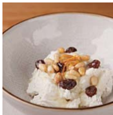
Ricotta Mousse with Honey, Orange Peel and Pine Nuts リコッタチーズのクリーム 松の実とオレンジピールのハニーソース