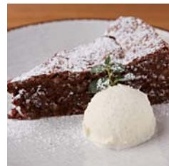
Chocolate and Almond Cake with Ice Cream カプリ風チョコレートケーキ クリームジェラート添え