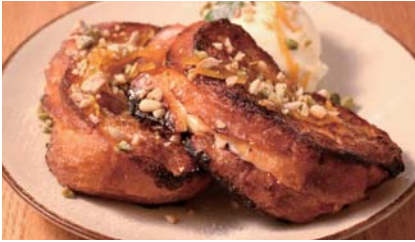
Mozzarella in Sweet Carozza